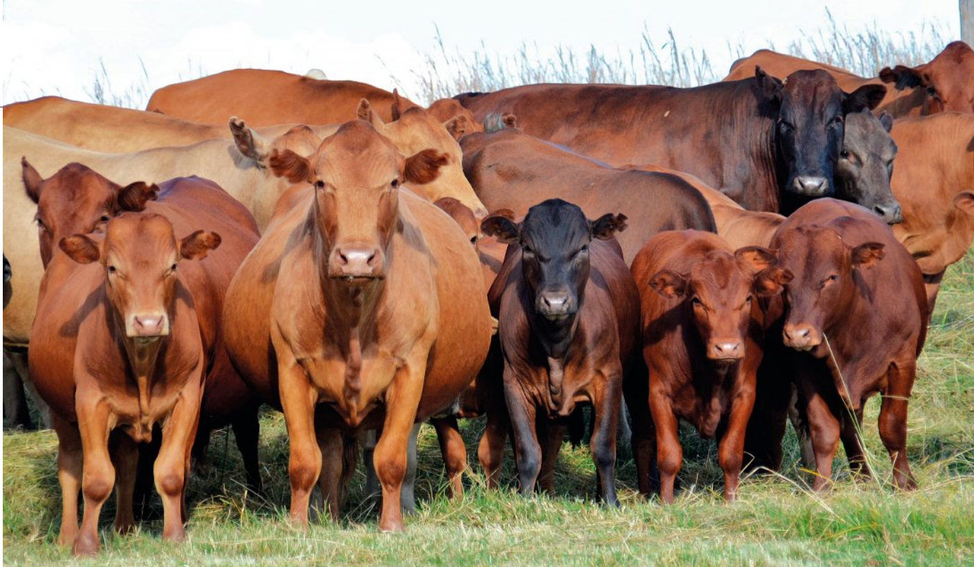
Tulibeeste op Rautenbach se plaas. Die oudste Tulistoetery in Suid-Afrika hou koste so laag as moontlik, maar selekteer streng vir vrugbaarheid en aanpasbaarheid.

gekeurdes wei deur die winter net op die veld, waarna hulle verder volgens kondisietelling en groei geselekteer en geweeg word. Dié wat te maer is, word uitgeskot. Dan bly net sowat 30% oor.