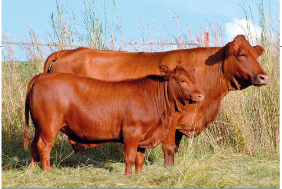
'n Mooi Tulikoei en haar kalf in die veld. Die Tuli bied goeie weerstand teen uitwendige parasiete.

Dit is 'n rektale immobiliseerder wat met 'n peilstif ( probe ) werk en die bees immobiliseer wanneer die boer brandmerke moet